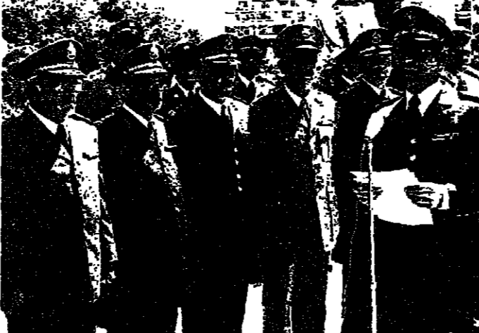
تقد مونغ بيروت بنو الاسرودس